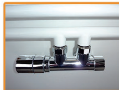
CK-Optima chrom Mittelanschluss