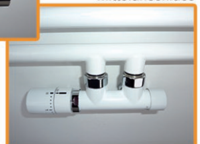
CK-Optima weiss Mittelanschluss